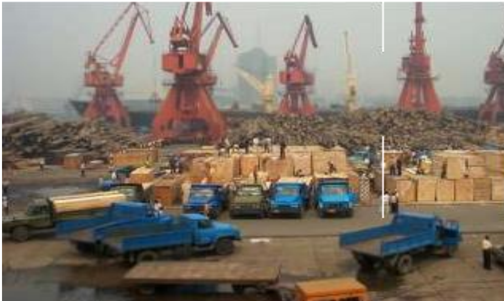
Figure 8 : L'importation de bois, sous forme de grumes et de bois scié, vers la Chine a augmenté de 7 à 10% par an au cours des deux dernières décennies. Le bois d'Afrique, qui n'est pas toujours légalement coupé et exporté, constitue une part croissante de cette importation. Image d'un port en Chine.

Bien que le bois comme combustible, y compris le charbon de bois, représente encore la plus grande partie du volume et de la valeur des produits dérivés des arbres, les produits forestiers conventionnels comme le bois et le bois à pâte sont en train d'augmenter rapidement d'importance. Depuis longtemps, l'industrie forestière basée sur les plantations en Afrique australe, le bois des concessions en Afrique centrale et les poches de peuplements naturels et de plantations (souvent détenues par le gouvernement) alimentant une petite industrie du sciage dans certaines parties de l'Afrique de l'Est et de l'Ouest ont représenté les principales formes d'exploitation forestière commerciale, formelle, primaire et secondaire. Aujourd'hui, ces activités augmentent rapidement et des investissements privés, coopératifs et communautaires dans les plantations forestières et l'industrie forestière sont visibles dans de nombreuses parties du continent.