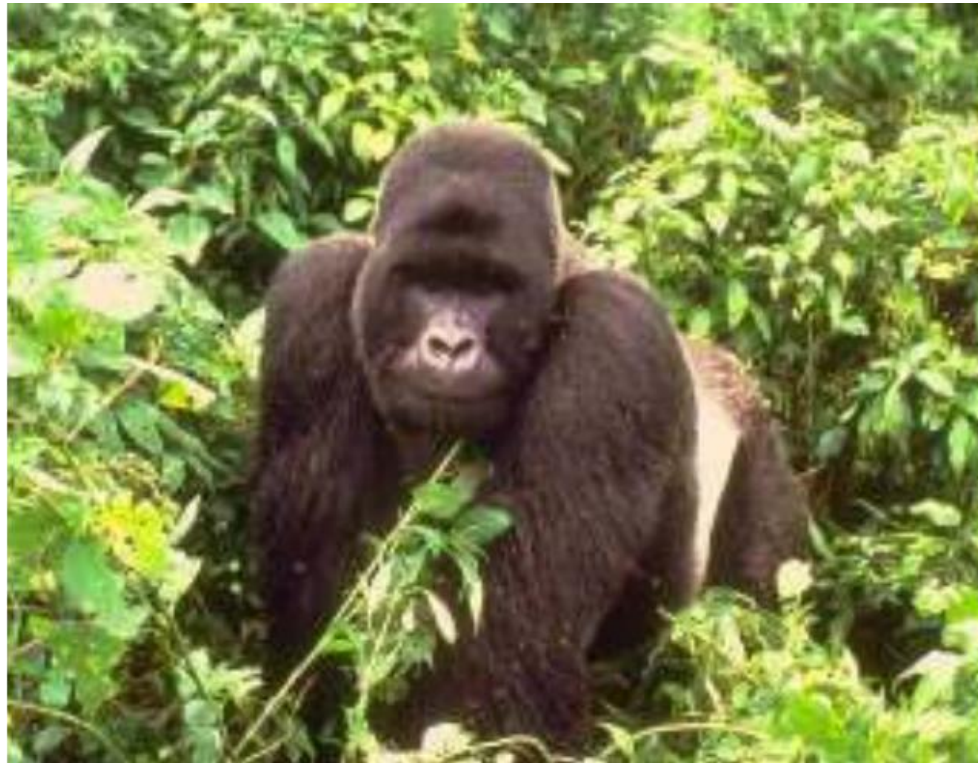
Figure 11 : Les efforts visant à protéger les gorilles de montagne et leur habitat forestier montagnard semblent avoir eu un succès modeste ces dernières années malgré les perturbations causées par la guerre civile.

La valeur de la biodiversité des forêts humides, des formations et savanes boisées d'Afrique, et des systèmes plus petits mais importants tels que les forêts montagnardes, les mangroves et les forêts galeries a été confirmée par de nombreuses études. Il en a été de même pour la documentation de la destruction rapide de ces valeurs à travers la déforestation et la dégradation. Malgré les réussites locales en matière de conservation et de protection, ou d'utilisation durable de cette biodiversité à travers l'écotourisme (dans les parcs nationaux ou les réserves), la situation reste sombre. Les efforts soutenus par les autorités nationales et les ONG locales, les entreprises privées et les organisations internationales telles que le WWF, l'UICN et le CI ont rencontré un succès mitigé et ne sont trop souvent pas viables lorsque le financement externe est coupé.