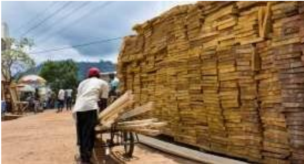
Figure 3 : Bois "informel" à vendre sur un marché de Yaoundé.

de continuer à considérer ce secteur comme illégal (et d'alimenter la corruption), il devrait être réformé sous de formes organisées et durables avec un soutien et une fiscalité appropriés.