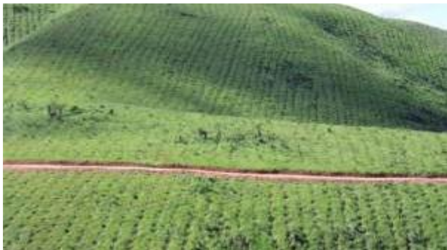
Figure 5 : La concurrence croissante pour la terre pour la production de nourriture, de fibre et de combustible en Afrique est une préoccupation majeure, mais aussi une opportunité pour attirer des investissements précieux.

de vastes étendues de terres avec une population clairsemée et une utilisation actuelle extensive des terres - par ex. les forêts de miombo d'Afrique australe, les formations boisées en Afrique de l'Est et les régions de forêt tropicale d'Afrique centrale - toutes modérément adaptées à la production à grande échelle de cultures vivrières et énergétiques et de plantations de bois.