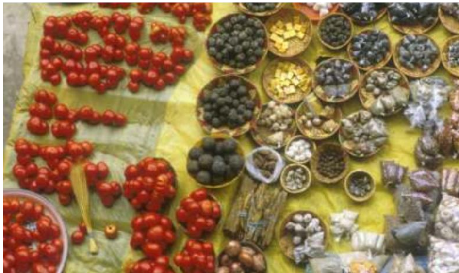
Figure 9 : Produits forestiers comestibles comme éléments essentiels de la sécurité alimentaire dans de nombreuses régions d'Afrique.

et la nutrition, un rôle qui est très rarement développé à son plein potentiel à travers l'amélioration génétique, la domestication, la gestion améliorée, etc., des arbres produisant des produits comestibles.