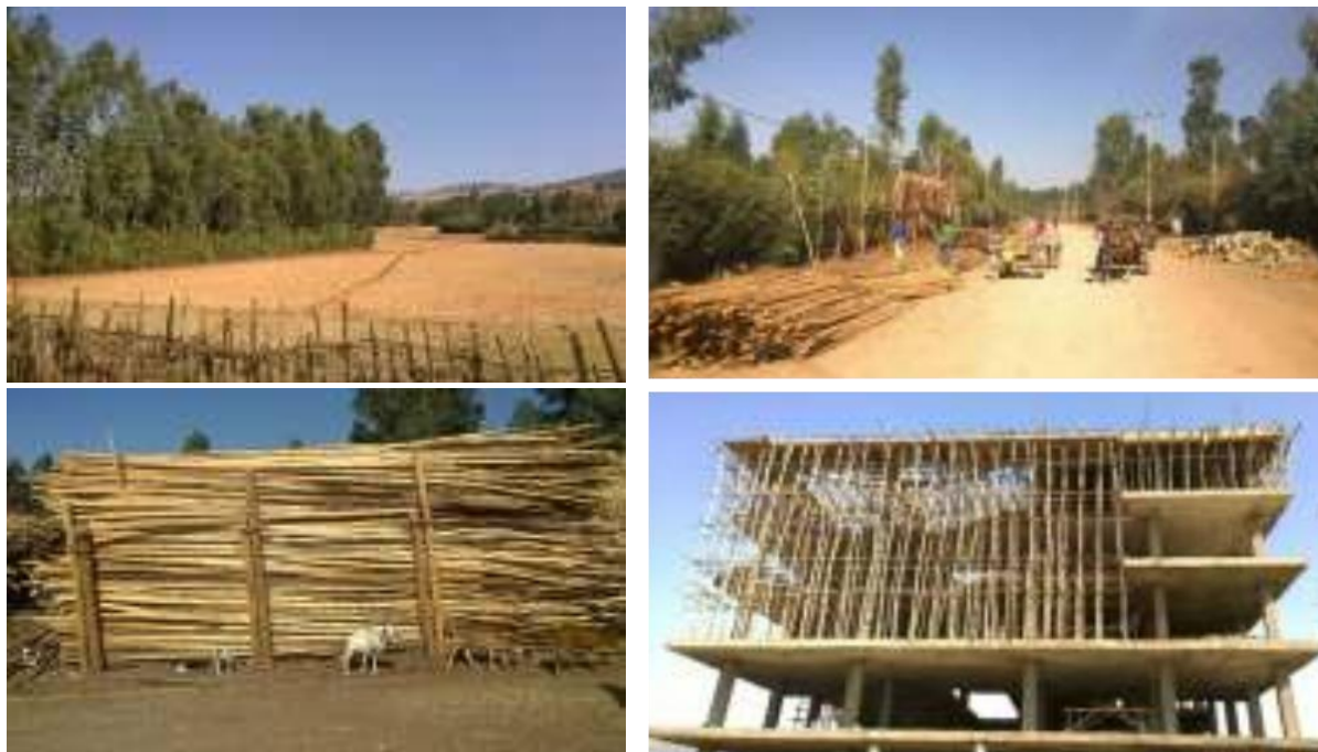
Figure 7 : La chaîne de commercialisation des poteaux d'échafaudage à base d' Eucalyptus pour le boom de la construction à Addis Abeba – En provenance des parcs boisés de petits agriculteurs, la vente le long des routes, le transport à AA, la vente aux constructeurs (à 2,50 USD par poteau!) pour une utilisation dans les travaux de construction et finalement se terminant en excellent bois de chauffage - est une entreprise énorme et en expansion, mais en grande partie non quantifiée.

Un autre produit de grande valeur dont la production bénéficie aujourd'hui à plusieurs paysans de l'Afrique de l'Est représente les poteaux de transmission d'électricité à base d' Eucalyptus spp. On estime que pour l'Afrique de l'Est seulement (Kenya, Tanzanie et Ouganda), il y a un marché de 3 millions de tels poteaux par an qui est toujours en croissance 3 .