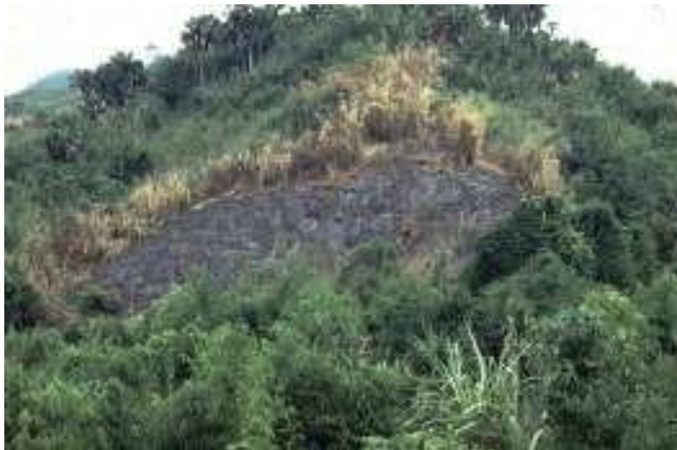
Figure 4 : La déforestation est encore endémique dans de nombreuses régions d'Afrique, toujours principalement causée par le défrichement des forêts et des formations boisées pour l'agriculture à petite échelle.