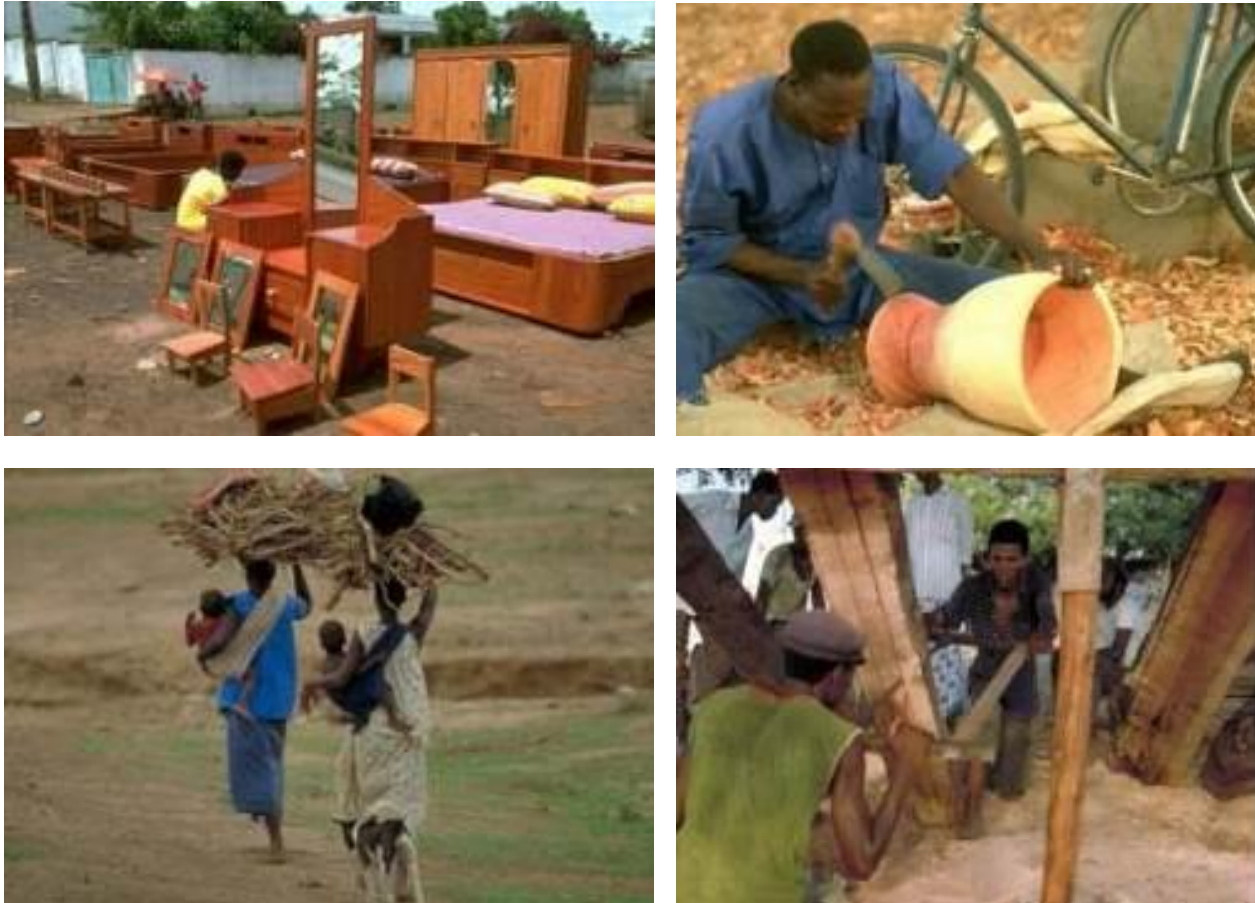
Figure 2 : Exemples de la multitude de produits ligneux primaires, secondaires et tertiaires qui tombent normalement en dehors des marchés formels et des statistiques officielles et, par conséquent, de la fiscalité.

qu'environ un demi-million de personnes en Afrique sont directement employées dans le secteur formel de la production primaire et de l'industrie du bois en Afrique sub-saharienne (FAO 2014b), tandis qu'au moins trois fois plus de personnes travaillent dans le secteur informel.