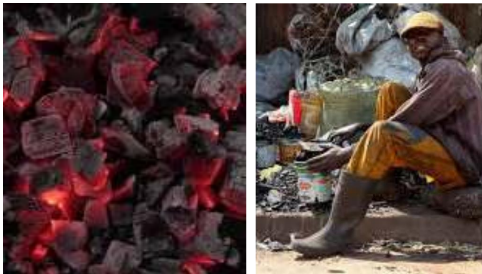
Figure 6 : La production, le transport et la vente de charbon de bois sont probablement les plus importants secteurs économiques informels du bois en Afrique aujourd'hui.

étude récente a-t-elle montré une grande valeur économique dans la production, le transport et la vente de charbon de bois (Shively et al., 2010).