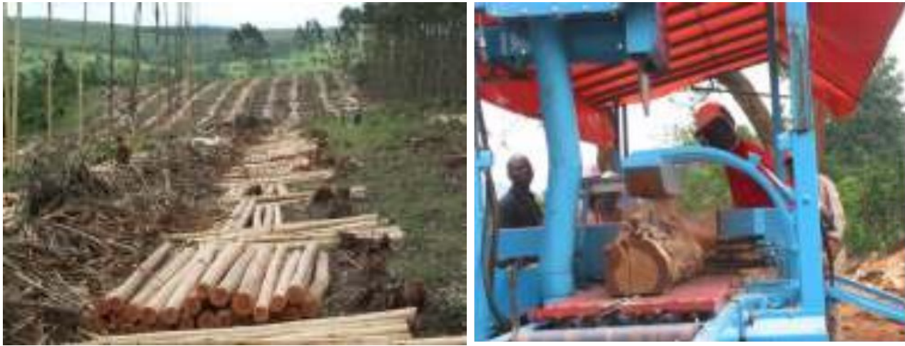
Figure 16 : La production rationnelle du bois à travers les plantations a un potentiel énorme dans une grande partie de l'Afrique, de la petite ferme d'îlots boisés aux grandes plantations commerciales.

anthropiques lorsqu'ils se produisent. Un autre aspect important de la gestion des risques est la connaissance et la préparation institutionnelle pour faire face aux ravageurs et aux maladies.