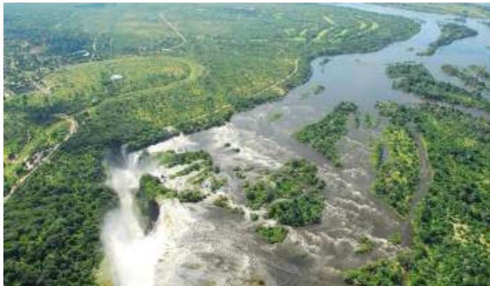
Figure 12 : Toutes les grandes rivières d'Afrique proviennent de zones forestières ou boisées. La protection et la gestion avisée de ces forêts sont d'une importance cruciale pour l'approvisionnement futur en eau du continent.

Enfin, une relation environnementale ancienne et bien connue impliquant les forêts est de nouveau en vue, à savoir le rôle de la végétation forestière et des arbres sur l'hydrologie des bassins fluviaux et lacustres (voir également la section ci-dessus sur la sécurité alimentaire). Il y a déjà cent ans, lorsque les puissances coloniales ont commencé à créer des réserves forestières dans les pays africains, la justification explicite était de protéger les sources d'eau (et bien entendu, de sauvegarder l'approvisionnement en bois). L'augmentation rapide de la population et le déboisement résultant de la nécessité de nouvelles terres agricoles ont mis un nouvel accent sur la question de la disponibilité de l'eau et de l'hydrologie.