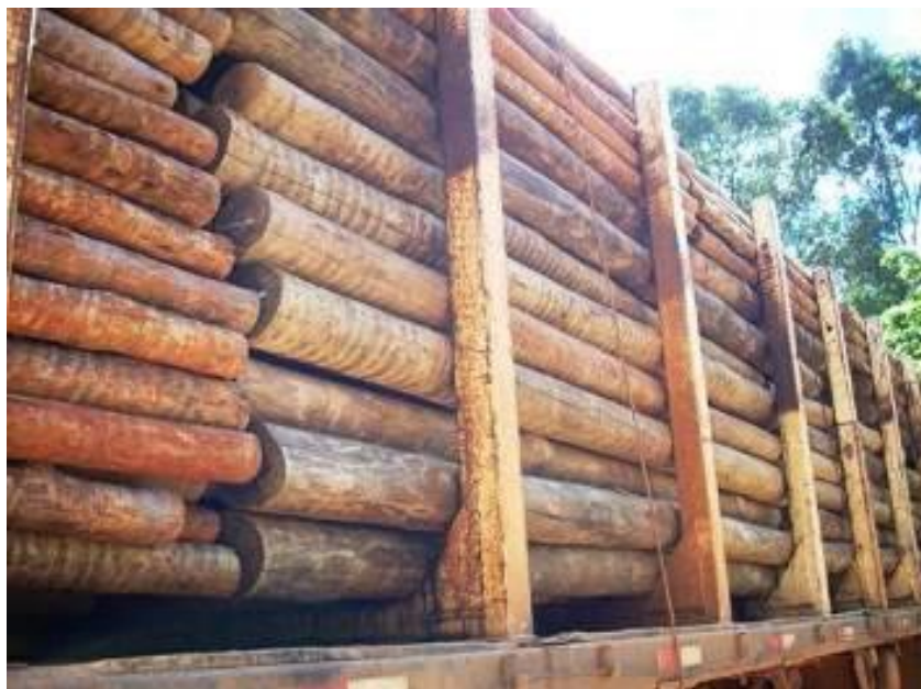
Figure 13 : Au cours des dernières décennies, il y a eu une explosion de la demande en poteaux de transmission d'électricité, ce qui a créé une activité économique très lucrative pour les agriculteurs, en particulier en Afrique orientale et australe.

Il s'agit non seulement, mais principalement, de la valeur primaire et ajoutée des produits forestiers ligneux et non ligneux, pouvant aussi inclure des avantages financiers directs de la conservation à travers, par exemple, l'écotourisme, ou des services écosystémiques tels que l'amélioration de la fertilité des sols et la disponibilité de l'eau, qui peuvent tous être exprimés et mesurés en termes quantitatifs et économiques. Tous les autres valeurs et rôles des forêts, y compris ceux essentiels et souhaités, comme la séquestration du carbone, les valeurs esthétiques et scientifiques, la protection de la biodiversité et des espèces, ne peuvent être pleinement remplis que combinés avec les valeurs économiques (souvent possibles mais exigeant des compromis), ou par des engagements politiques et moraux des gouvernements à compenser les opportunités économiques perdues là où des utilisations conflictuelles ne peuvent être conciliées.