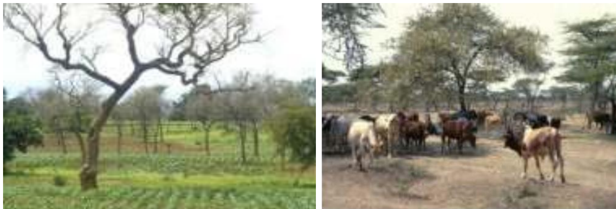
Figure 10 : Dans une grande partie de l'Afrique, il existe une couverture forestière assez dense dans divers systèmes agroforestiers et sylvo-pastoraux d'utilisation des terres. Beaucoup d'efforts de R & D aujourd'hui, par exemple par l'ICRAF en collaboration avec les institutions nationales, visent à améliorer ces composants et systèmes de gestion d'arbres.