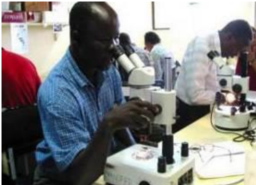
Figure 15 : La recherche forestière doit être renforcée et, en particulier, se focaliser sur les problèmes et les potentiels qui présentent un intérêt réel pour l'Afrique.

extérieurs pour leurs travaux, notamment de petites (par exemple IFS et diverses ONG) et plus grandes (par exemple, CRDI et certaines agences bilatérales et multilatérales) subventions de recherches, des accords de partenariat et des opportunités d'études doctorales à l'étranger.