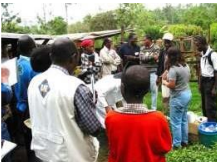
Figure 14 : La nécessité de former des formateurs, sous la forme d'un personnel de vulgarisation forestière de niveau intermédiaire, est aujourd'hui énorme en Afrique.

Les établissements d'enseignement supérieur sont parfaitement adaptés aux besoins des grandes régions de pays partageant des conditions, des opportunités et des défis agro-écologiques, sociaux et économiques similaires. Certains d'entre eux attirent déjà des étudiants d'autres pays, mais ces mandats régionaux devraient être renforcés et reconnus par la ratification par les organismes régionaux déjà existants tels que l'EAC, la SADC, la CEDEAO, le CILSS, etc. De plus, le renforcement de la collaboration et du réseautage au sein du continent aussi bien entre les institutions similaires qu'avec le secteur privé et ONG, et avec les institutions d'enseignement et de recherche hors de l'Afrique conviendraient. Le rôle des institutions d'enseignement supérieur d'offrir de formation de mise à niveau aux diplômés forestiers déjà actifs sur les aspects actuels et émergents de leur domaine devrait également être renforcé.