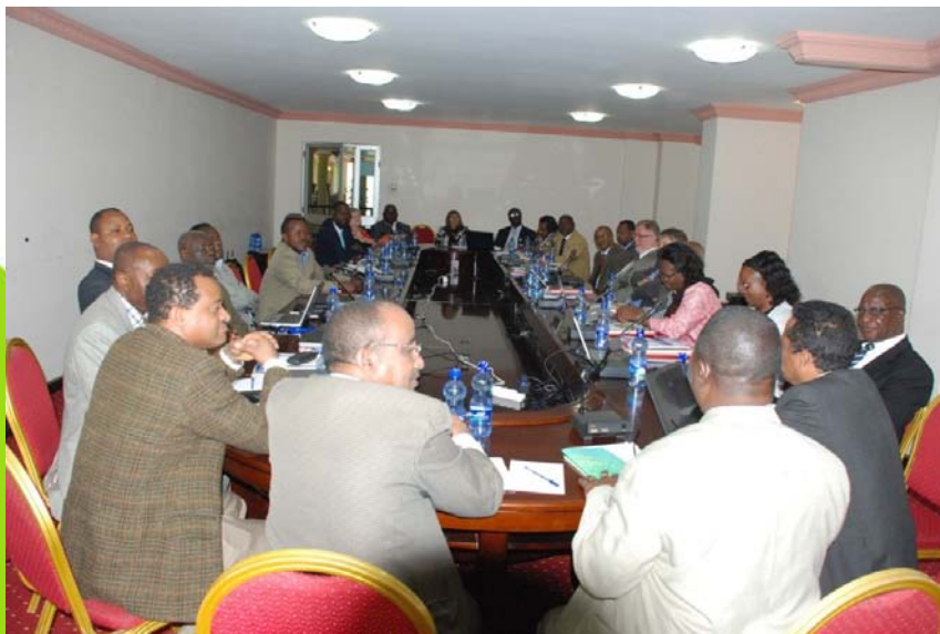
La 10 ème Session du Conseil d'Administration du Forum Forestier Africain (AFF)

A cette réunion, l'AFF s'est engagé à continuer à apporter sa contribution technique comme l'a voulu le Comité, tout en explorant d'autres pistes d'intérêt mutuel dans le domaine de la foresterie et des ressources arboricoles. Le comité a informé d'une réunion qui se tiendra à Bujumbura, Burundi les 10-13 mars pour développer davantage le plan de projet de loi, après quoi il fera l'objet d'audition publique dans les cinq Etats partenaires avant d'être déposé aux divers organes de la Communauté est-africaine.